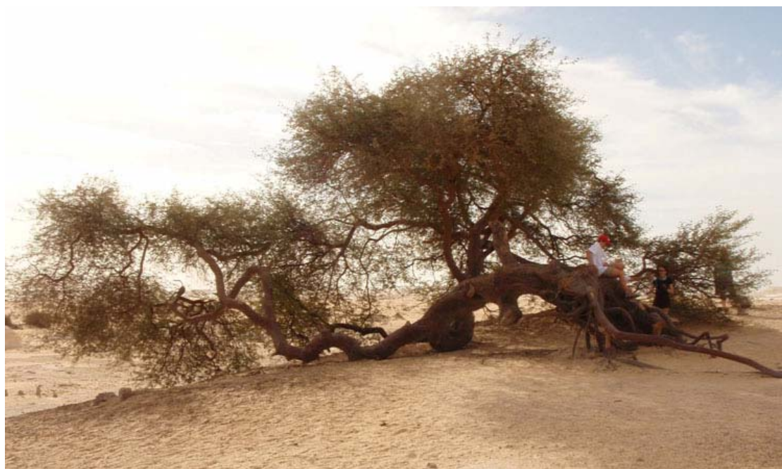
Fig. 1 – L'arbre, dernière trace végétale dans un paysage presque entièrement désertifié. Ses racines lui permettent d'atteindre des nutriments, des zones humides du sol et éventuellement la nappe phréatique sous la couche superficielle de sol dégradé © F. Peter.

Jean-Paul LANLY - Secrétaire Perpétuel, Académie d'Agriculture, France. Ancien Directeur « Forêts », FAO